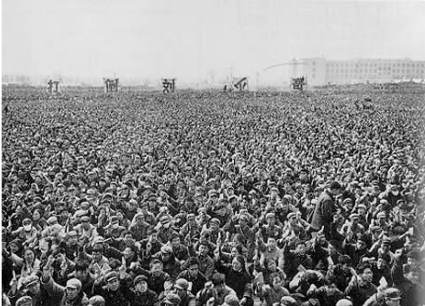
1967年4月10日，清华大学红卫兵召开批斗王光美大会。