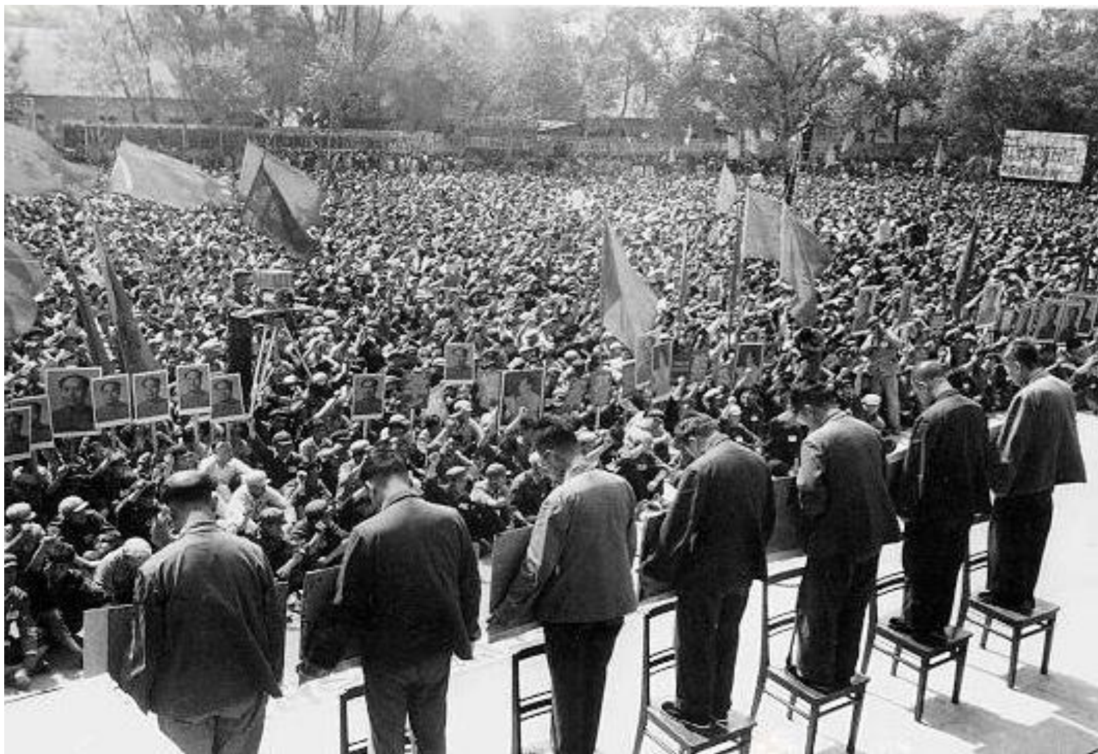
黑龙江省委书记处的书记集体被批斗。