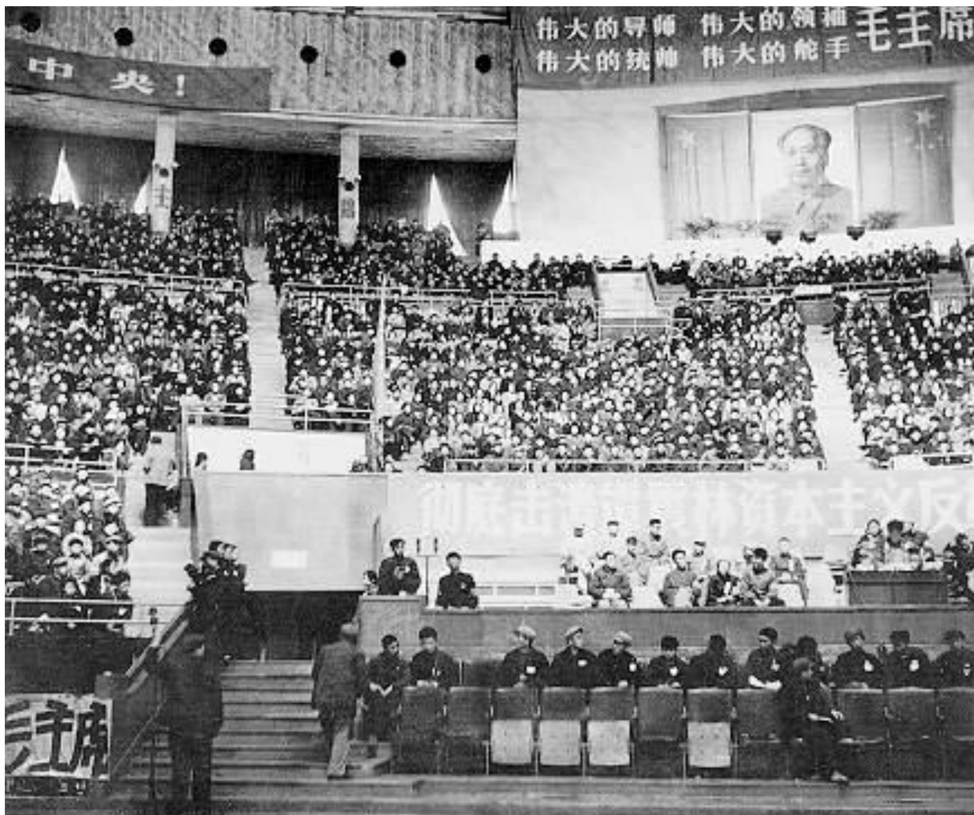
国务院副总理谭震林在反击“二月逆流”的运动中首当其冲，这是“专门”为他召开的批斗大会。