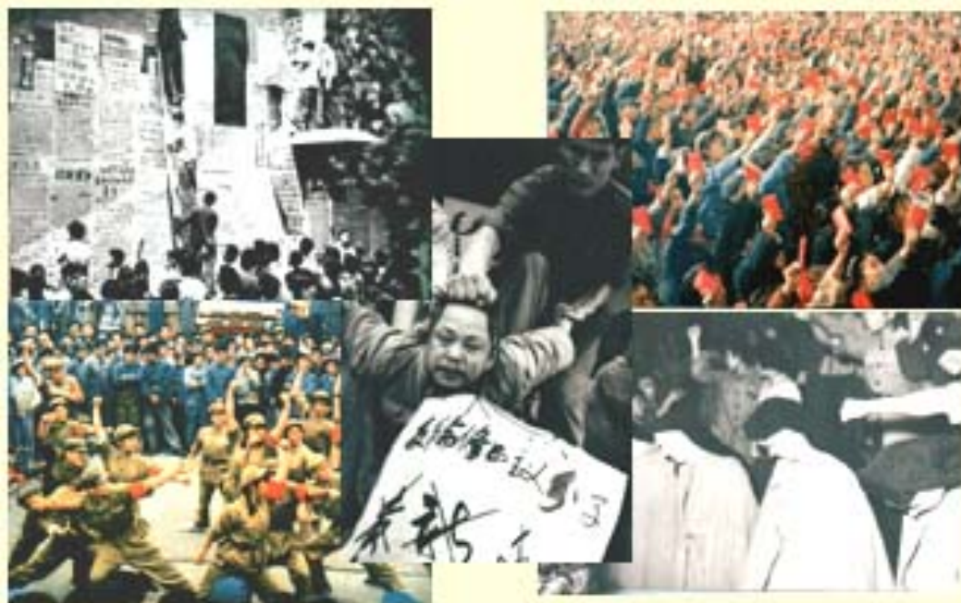
Chinese Cultural Revolution (1966-1976)