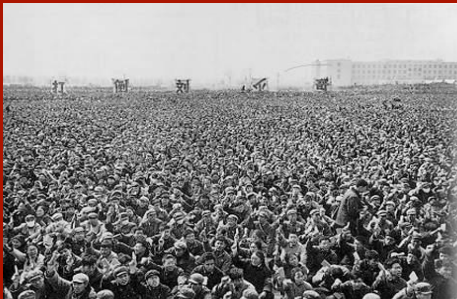
1967年4月10日，清华大学红卫兵召开批斗王光美大会。